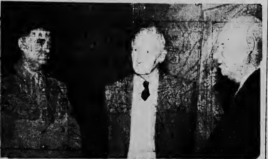
Riba e foto aki di r.p.dr. e mariscal Ruso V. Skolosky, Montgomery y Chroestsjef. E foto aki a worde saca duran te bishita di Montgomery na Kremlin.

Montgomery ta yega na e conclusio n cu su bishita na Moscu tabatin un efecto util.